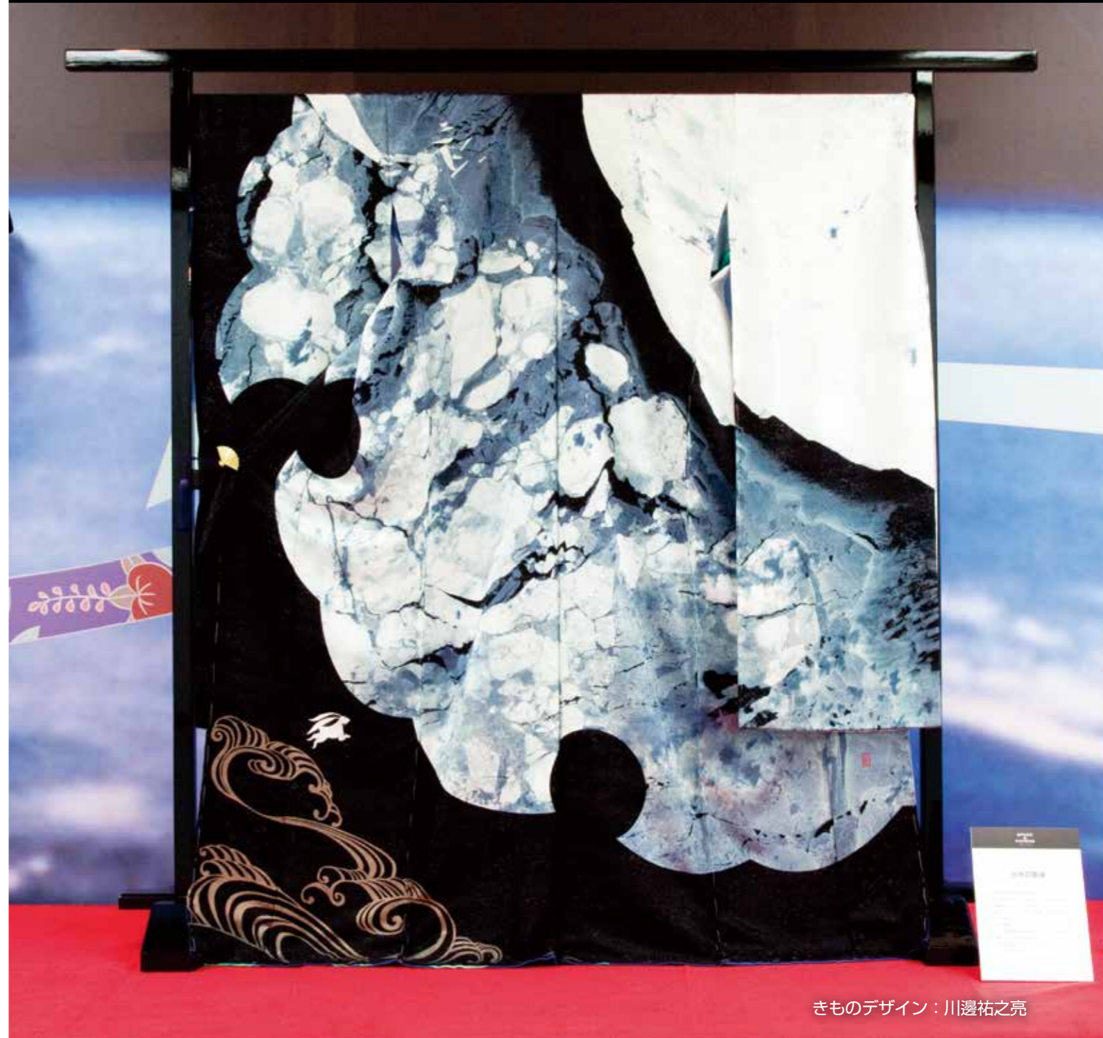
きものデザイン：川邊祐之亮