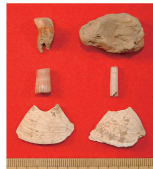
サキタリ洞遺跡Ⅱ層の出土品