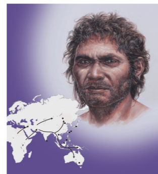
表紙イラスト 港川人のアジア南方起源説をもとに描いた復元モデル。画家は山本耀也氏です。1号頭骨の特徴を反映させながら、眼などにアボリジニ的要素を入れて作成されました。